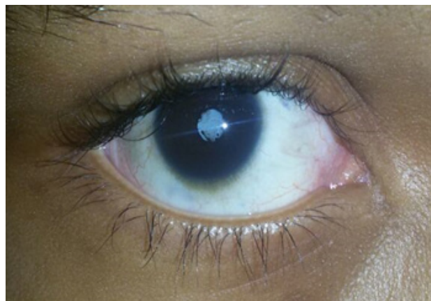
Figura No.1: Ojo derecho con catarata madura

La evaluación oftalmológica mostró agudeza visual de ojo derecho (OD) sin percepción de luz y ojo Izquierdo (OI) con visión 20/20. En OD se observa cornea clara, cámara anterior formada, sinequias posteriores, catarata madura y fondo de ojo no evaluable.