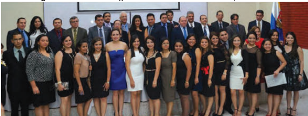
Se encuentran: graduandos acompañados por docentes y autoridades que asistieron al evento, el cual se realizó el viernes 06 de septiembre de 2013.