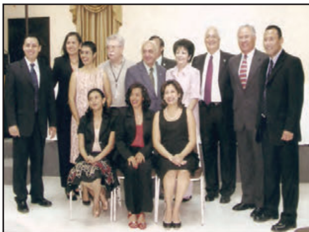
Se encuentran: Miembros de la Comisión de Transición, Representantes de la Facultad de Ciencias Médicas y Planta Docente inicial.

En Agosto del 2006 con el inicio de las ciencias morfológicas la matrícula se realizó con un cupo limitado de únicamente 40 estudiantes de excelencia académica, quienes fueron aperturando cada periodo académico, para el 2011 la carrera ha completado el séptimo año que equivale al internado rotatorio, contando con Médicos en Servicio Social para el año 2012, hasta culminar, juramentarse en ceremonia solemne y graduarse en el 2013 un total de 29 médicos, (Ver Figura No. 2) (7) así han continuado finalizando haciendo un total para el 2015 de 102 médicos graduados. (8)