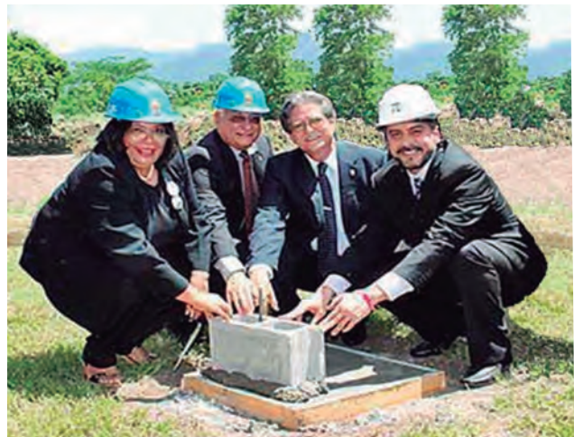
Figura No. 3: Colocación de la primera piedra del Complejo de la EUCS.