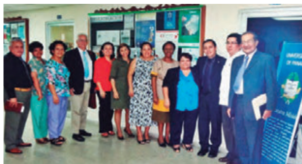
Equipo de Académicos de la EUCS y de la UP.

Figura No. 2: Intercambio de experiencias en la Universidad de Panamá, UP. Mayo 2014