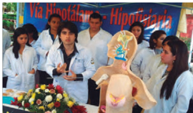
Figura No. 1: Feria Científico Cultural de la EUCS, Primer Semestre 2013

Estudiantes de Ciencias Morfológicas en presentación del tema.