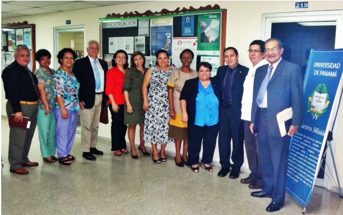
Equipo de Académicos de la EUCS y de la UP.

Julio 2014: Proyecto de Movilidad: “Fortalecimiento del desarrollo de competencias docentes y estudiantiles en el manejo de la terminología morfológica internacional y el campo de investigación en el área de ciencias morfológicas” participación de ocho docentes y nueve estudiantes del Departamento de Ciencias Básicas de la Salud de la EUCS, de las diferentes carreras; Enfermería, Odontología y Medicina en el 10° Simposio Ibero-latinoamericano de Terminología Anatómica, Embriológica e Histológica (SILAT X), que se realizó en Managua, Nicaragua, en el Campus de la Universidad Nacional Autónoma de Nicaragua. (13)