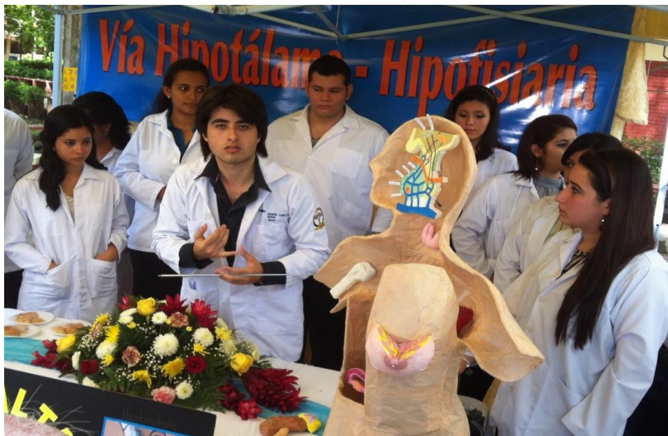
Estudiantes de Ciencias Morfológicas en presentación del tema.